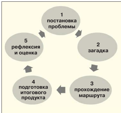
Рис. 1. Технологический цикл квест-технологии

и позволяет выявить наиболее очевидные сходства этнокультур и характерные культурные различия.